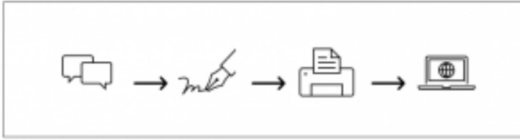
Gambar rajah : Evolusi Sastera Melayu Tradisional-Moden-Era Digital

Menyingkap sejarah perkembangan kesusasteraan Melayu hari ini, tradisi lisan muncul apabila dikatakan dunia Melayu mula menerima pengaruh luar iaitu dari India namun sistem tulisan yang diperkenalkan tidak meluas dan akhirnya pupus. Kemudian sistem tulisan Jawi berdasarkan sumber al-Quran telah diperkenalkan dengan kedatangan agama Islam yang kemudiannya disesuaikan dengan sebutan dalam bahasa Melayu. Istana merupakan pusat perkembangan kesusasteraan dan melahirkan tokoh-tokoh sasterawan Melayu yang menghasilkan karya sama ada asli atau salinan semula.